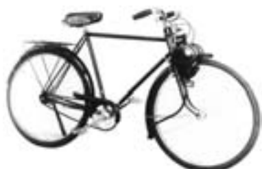
Le premier prototype de Solex ( http://solexin.free.fr )

Le VéloSolex compte toujours des pratiquants nostalgiques et néanmoins passionnés. Parmi eux, l'association Les Amis du Solex située au Thor dans le Vaucluse, a réuni un patrimoine rare autour du fabuleux deux-roues. L'exposition présentée à L'Isle sur la Sorgue est constituée de différents modèles de Solex ainsi que de moteurs en pièces détachées, en cours de rénovation et rénovés. L'ensemble présente l'évolution d'une rénovation d'un moteur de la marque. Du traditionnel modèle version 3008 aux pièces plus originales qui jumèlent deux moteurs de Solex et une trottinette par exemple, l'exposition Les Amis du Solex nous conduit au cœur des années d'après guerre aux années 80, en 1988 plus exactement, année de l'arrêt de la production du Solex.